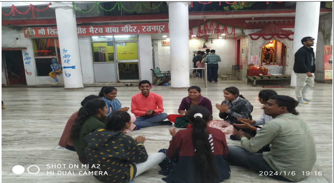
Ratanpur Temple, Bilaspur